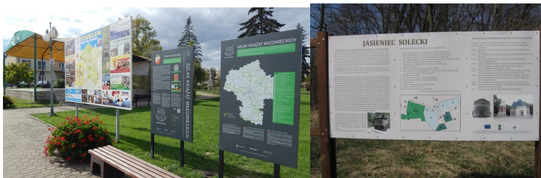
Tablice informacyjne na rynku w Zwoleniu