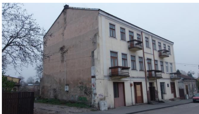
Budynek przy ul. Kościelnej 3