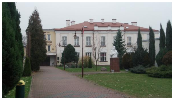
Budynek szkoły z początku XX wieku