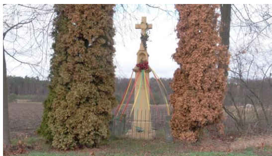
Kapliczka w Jedlance