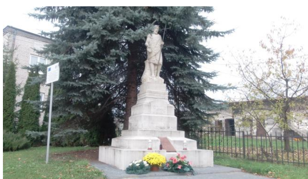
Figura św. Jana Chrzciciela w Zwoleniu