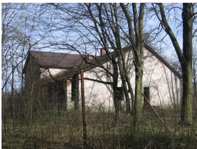
Dawny dwór Iwana Szabelskiego z 2 połowy XIX wieku