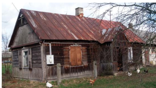
Dom we wsi Atalin nr 20