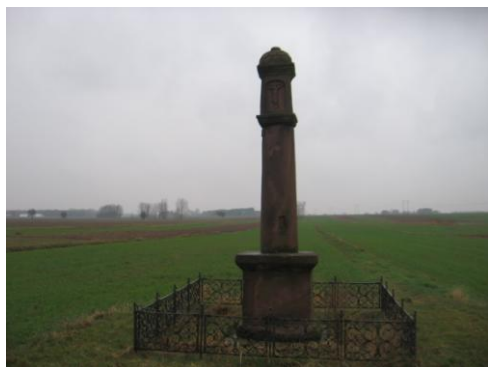
Kapliczka w Sycynie