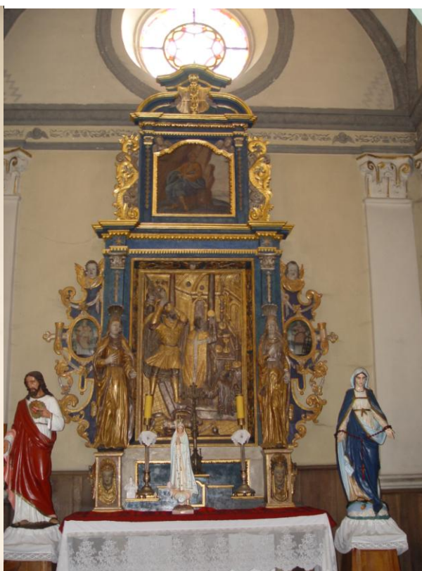
Ołtarz późnorenansowy z kaplicy Owadowskich