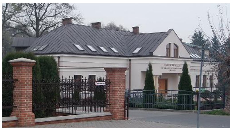
Centrum Regionalne przy Nekropolii Jana Kochanowskiego (obecna siedziba Muzeum Regionalnego w Zwoleniu)

Na terenie gminy Zwolen funkcjonuje Muzeum Regionalne. Placowka ta udostepnia obecnie swoje zbiory na ekspozycji w zabytkowym budynku Centrum Regionalnego przy Nekropolii Jana Kochanowskiego w Zwoleniu.