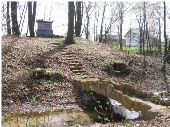
Pomnik – sarkofag z 1800 roku w Jasieńcu Soleckim (Kolonja)

W kościele parafialnym Jasieńcu Soleckim znajdują się zabytki ruchome stanowiące wystrój i wyposażenie tych kościołów, nie wpisane do rejestru zabytków, ale znajdujące się w wojewódzkiej ewidencji zabytków (posiadają karty zabytku ruchomego).