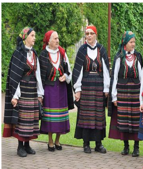
1. Zespół Gotardowie