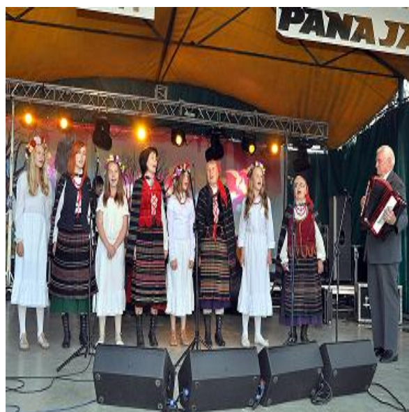
2. Zespół Strykowice