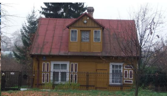
Dom przy ul. św. Jana w Zwoleniu