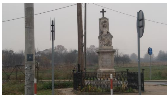
Figura Królowej Jadwigi w Zwoleniu