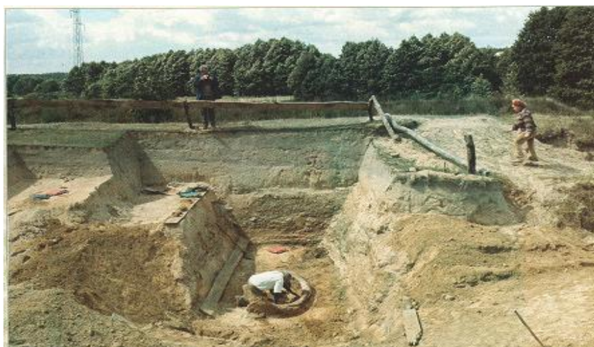
Stanowisko archeologiczne „Strzelnica” – badania wykopaliskow

Najstarsze ślady osadnictwa pradziejowego na terenie gminy Zwoleń, pochodzą z młodszej epoki środkowego paleolitu. Związane są ze stanowiskiem Zwoleń - „Strzelnica”, na którym odkryto reliktory obozowiska tzw. łowców neandertalskich, datowane na okres 80-65 tys. lat p.n.e. Odkrycia dokonano przypadkowo na początku lat 80-tych XX w.