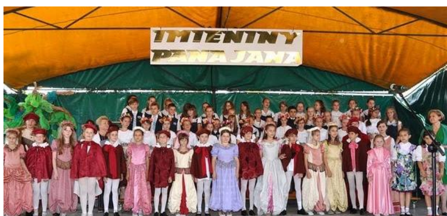
Impreza kulturalno-artystyczna Imieniny Pana Jana

Wspomniane zespoły biorą czynny udział w różnego rodzaju imprezach i festiwalach, pielęgnując przy tym regionalną tożsamość sfery kulturowo-obyczajowej. Przedstawiają szeroki repertuar pieśni, zwyczajów, obrzędów, a także prezentują tradycyjne potrawy oraz rękodzieło ludowe. W tym m.in. wykonują różnego rodzaju rekwizyty do odtwarzania zwyczajów i obrzędów ludowych jak np. : wieńce dożynkowe, pisanki, wianki, palmy itp. Na proces utożsamiania mieszkańców z kulturą regionu mają także duży wpływ, organizowane przez lokalny samorząd i podległe im instytucje , imprezy o charakterze kulturalno-artystycznym oraz folklorystycznym. Wymienić należy w tym miejscu chociażby sławne w skali województwa Imieniny Pana Jana związane z poetą Janem Kochanowskim czy Biesiady Gawędziarzy, Poetów i Śpiewaków Ludowych.