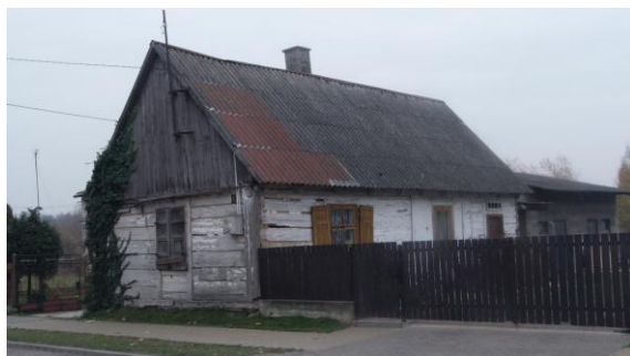
Dom przy ul. Słowackiego 28

snycerskie zwieńczenia nadokienne, fryz podokapowy, okiennice. Budynek w Męciszowie nr 40 również posiada dekorację snycerską i okiennice.