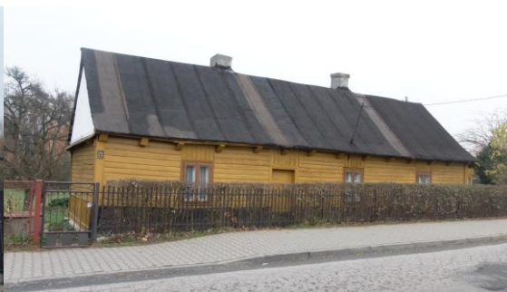
Dom przy ul. Cmentarnej 25