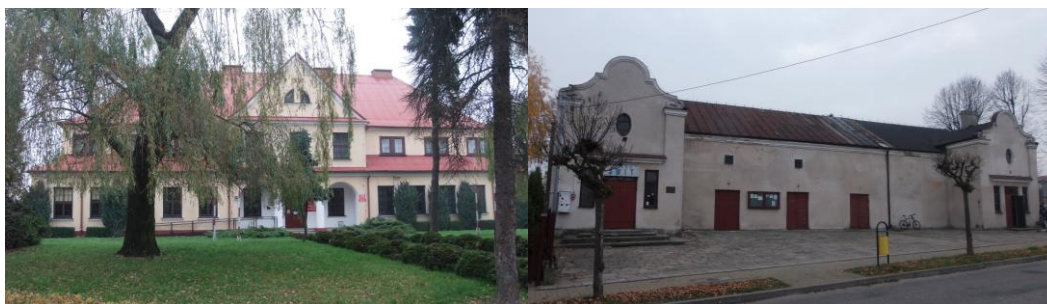
Budynek Technikum Rolniczego z 1925 roku

W Zwoleniu zewidencjonowanych jest kilka zabytkowych, charakterystycznych i ważnych obiektów użyteczności publicznej. Artystycznie najciekawszy jest: zespół budynków szkoły rolniczej w Zwoleniu. Powstały w 1925 roku na potrzeby Ludowej Szkoły Rolniczej Męskiej. Architektura budynków nawiązywała do dawnego budownictwa dworkowego poprzez realizację ganku filarowego oraz dachu naczółkowego. Przy ul. Kościelnej usytuowany jest piętrowy budynek szkoły z początku XX wieku. Eklektyczny wystrój architektoniczny przejawia się w artykulacji elewacji lizenami, wydatnym gzymsie, łukami nadokiennymi, centralnie umieszczoną attyką, Na uwagę zasługuje również budynek dawnej remizy i kina z charakterystycznymi neobarokowymi szczytami dwóch skrajnych ryzalitów.