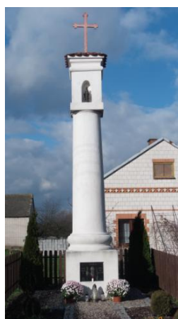
Kapliczka w Paciorkowej Woli