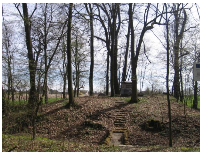
Pomnik – Sarkofag na terenie parku w Jasieńcu Soleckim (Kolonii)