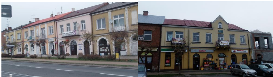
Zabudowa pierzejowa, przyrynkowa, północna

jednookienną facjatą flankowaną wolutami. Ten typ budynków był przed wojną często spotykany. W Zwoleniu zachowały się również skromniejsze domy drewniane z facjatami. Trzeci typ to budynki piętrowe o prostokątnych otworach drzwiowych i okiennych, charakterystyczny dla innych ośrodków małomiasteczkowych w woj. mazowieckim. Odznaczał się profilowanym gzymsem, ewentualnie występowaniem lizen czy ażurowych, żeliwnych balkonów i płytyn (kamienica przy ul. Kościelnej 3). Oprócz wymienionych typów funkcjonowała szeroko zabudowa mająca charakter typowo wiejski.