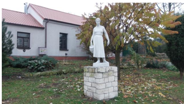
Figura Kobiety z dzbankiem w Zwoleniu