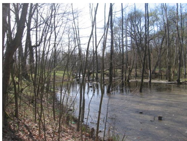
Stawy we wschodniej części założenia parkowego