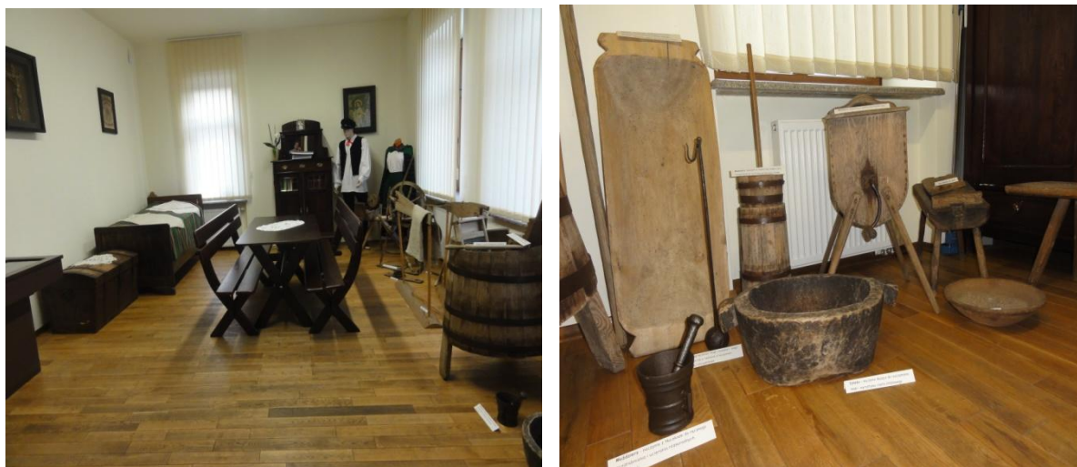
Wystawa etnograficzna Muzeum Regionalnego

Instytucja ta prezentuje m.in. eksponaty posiadające charakter etnograficzno-historyczny, przedstawiajcy szeroko rozumianą kulturę materialną mieszkańców Ziemi Zwoleńskiej. W salach wystawowych można obejrzeć różnego typu zabytki związane z dziedzictwem kulturowym Zwolenia i okolic.