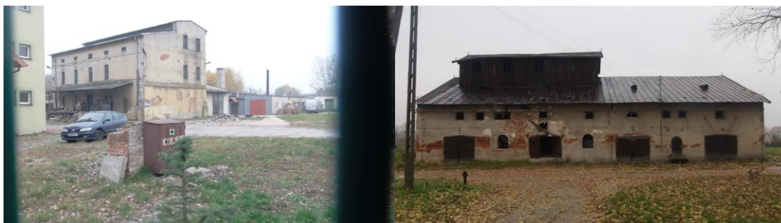
Młyn elektryczny w Zwoleniu

na nadbudówce dwuspadowy. Elewacje dzielone s prostymi poziomymi listwami. Otwory okienne prostoktne i zakoczone łukiem odcinkowym.